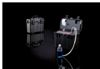
Boîtier robuste PAMAS GO

pour les fluides hydrauliques à base du mélange eau glycol, l'eau douce, l'eau de mer et les produits chimiques