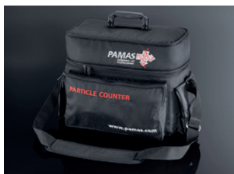
Bolsa de hombro PAMAS GO

El bolso bandolera a medida proporciona espacio adicional para accesorios.