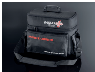
Sac à bandoulière PAMAS GO

Le sac à bandoulière sur mesure offre un espace supplémentaire pour les accessoires.